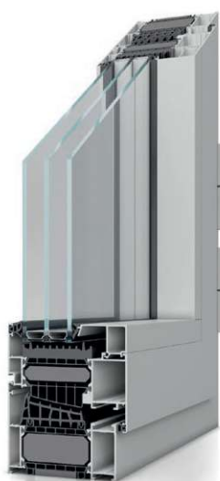
MB-104 Passive SI