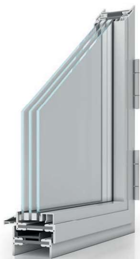
JANSSEN Janisol Arte