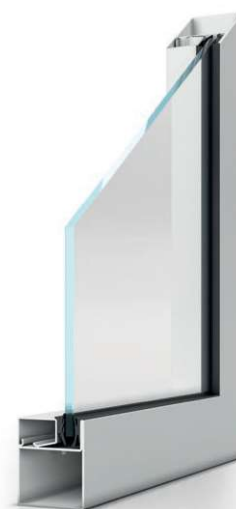
JANSEN Economy 50