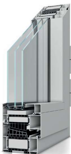
MB-104 Passive AERO